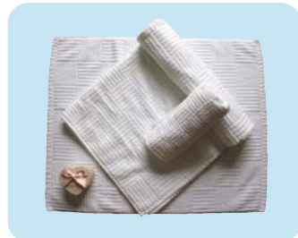
CB2155 バスタオル (75×145cm 1500 匁) CF3305 フェイスタオル (34×90cm 300 匁) RBM1108 バスマット (48×65cm 1000 匁)

製造・販売元 みきせいさんぎょう 三紀繊維産業有限公司 TEL 072-447-2297 FAX 072-446-4755 Mail info@mikiseni.jp http://mikiseni.jp