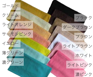
CF3240 フェイスタオル (34×85cm 240 匁)