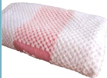
パイルワッフル抜きカラー