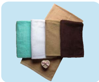
CB2200 大バスタオル 5色 (100×180cm 2000 匁)