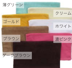
CF3260 フェイスタオル (34cm×85cm 260 匁)