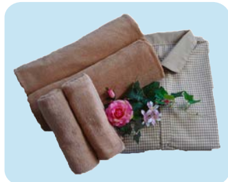
CB2107 バスタオル ブラウン CF3240 フェイスタオル ブラウン M5500 ガウン ブラウン