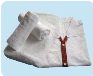
LB2170 バスタオル (68×140cm 1700 匁) LF3340 フェイスタオル (34×85cm 340 匁)

製造・販売元 みきせいさんぎょう 三紀繊維産業有限公司 TEL 072-447-2297 FAX 072-446-4755 Mail info@mikiseni.jp http://mikiseni.jp