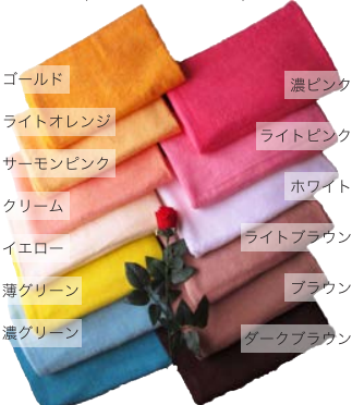
CB2107 バスタオル (70×140cm 1000 匁)