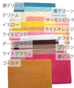
RBM1707 バスマット (40×60cm 700 匁)