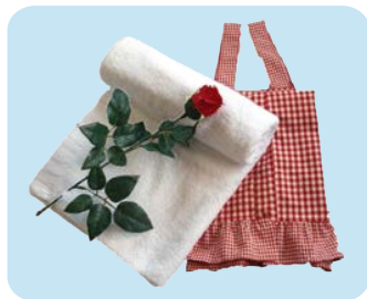
BB2128 バスタオル (68×132cm 1200 匁)