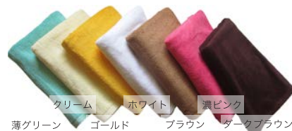
CB2127 バスタオル (70×140cm 1200 匁)